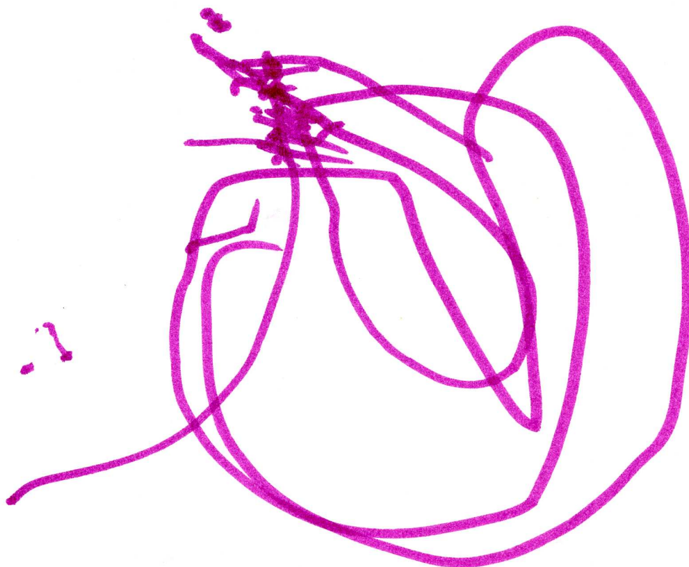
Scarabocchi di una bambina di 2 anni e 9 mesi.

Prevale la curvilinearità, in un contesto grafomotorio che non esclude linee, angoli, punti e fasi di tensione che provocano fasi di colorazione concentrata. Prevalgono tratti netti e decisi e continuativi. Questa bambina manifesta graficamente la sua vitalità, la spinta motivazionale ad agire e richiede modi educativi fermi, calmi, che nel contempo sappiano dare risposte affettive alla sua emotività che cerca riscontri