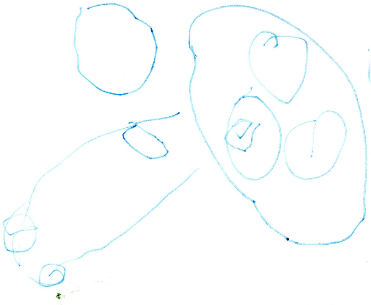
Prime raffigurazioni dell'omino fatte da una bambina di 2 anni e 8 mesi.

Il tratto è leggero, con non omogeneità della forza d'incisione (segno di elevata emotività), gli elementi presentano un ritmo tendenzialmente armonico, la produzione grafica è orientata verso destra. E' elevato il livello formale nelle sue prime raffigurazioni dell'omino. E' una bambina molto sensibile, intuitiva, capace di osservare con attenzione il mondo che la circonda. Va trattata con delicatezza, evitando di cadere nell'iperprotettività e abituandola a fare le cose con ritmi vitali organizzati: sovraccaricarla sarebbe dannoso.